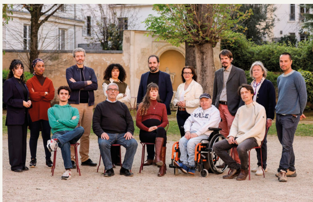
© L'Affaire du Siècle, les demandeur-euse-s du recours

Le 8 avril, un collectif de 13 sinistré-e-s climatiques et associations citoyennes, ainsi que les organisations co-requérantes de l'Affaire du Siècle – Greenpeace France, Notre Affaire à Tous et Oxfam France – ont porté un nouveau recours devant le Conseil d'État.